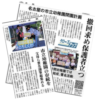
▲桶狭間幼稚園の存続を求める運動を報じる「しんぶん赤旗」紙面

教育長は「各園の園児数減少は、幼児人口の減少や保護者のニーズの変化など様々な要因がある」と述べました。