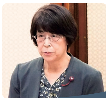
岡田ゆき子議員 (北区)