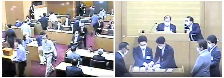
名古屋港管理組合議会での議長・副議長選挙の様子。 左：投票、右：開票状況