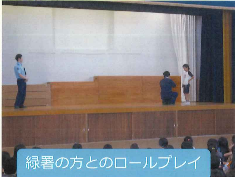
緑署の方とのロールプレイ