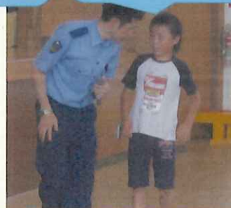
警察の方と振り返り