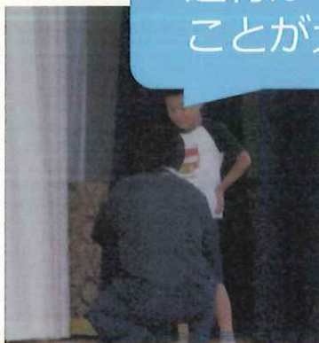
不審者役の警察の方と のロールプレイ