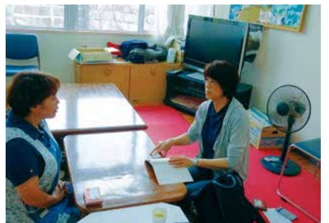
▲熊本県西原村の障がい者福祉施設を訪問する岡田議員

防災危機管理局長は「熊本地震をふまえ、さらに対策を加速させる必要がある」と答弁。必要な機材の設置は、防災危機管理局の統括の下、「関係局において早急に対応してまいります」と答弁しました。