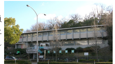
1968年開館の千種図書館

自民党や民主党の議員は、河村市長が止めた事実は指摘していましたが、請願は「保留」となりました。