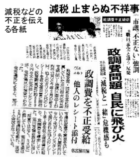
市議・県議の政調費疑惑（*は辞職）