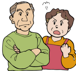
介護保険料に関する区役所への問い合わせ件数 (4月4日～12日分)

「年金額は引き下げられたのにどうやって生活するんだ」「介護保険料を払ったら利用料が払えず利用を制限しないとイケない」など、市民の苦情が窓口に殺到し、4月4日から14日までに3538件の苦情・問い合わせがでています。