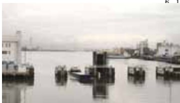
堀川口水門（向うが海）

堀川口水門は「津波が来る時は閉まる」というのが地域の人々の認識でした。山口議員は実際の潮位グラフや水門の開閉時間を示しながら「津波警報が出てもあいたまま、閉鎖しても引き波で水門が壊れるからと開放、その後閉鎖したが、最高潮位時には開放状態」という混乱し