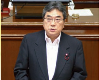
さとう典生議員 徳山ダム導水路

6月議会では、日本共産党の3人の議員が個人質問を行い、市政の課題について問題点を指摘し、具体的な提案を行いました。