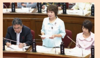
子どもの医療費無料化の拡大を要求し続けてきた日本共産党。

国が70～74歳の医療費2割負担を実施した場合の独自助成についても、質問にこたえて1割維持を約束。